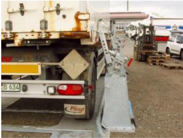
Befestigte Stützen an einer Wechselbrücke

Die BoxStation eignet sich für ISO-Container sowie Wechselbehälter. Container bis zu 36 Tonnen können auf der BoxStation abgestellt werden. Zusätzlich kann der abgestellte Container von einem Gabelstapler mit bis zu 4 Tonnen zum Be- und Entladen befahren werden.