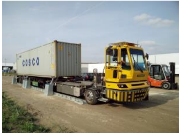
Double BoxStation für 20', 40' und Wechselbrücke